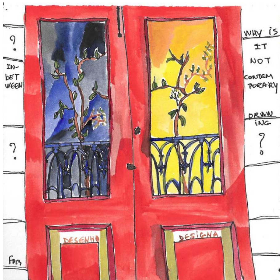
Fig. 3 What is contemporary drawing? – November 2013

As a drawing which searches to embody the research, the fig. 3 was designed in a current phase, where I am questioning the limits of drawing in visual arts teacher training. What kind of drawing teaching can be found? What is influencing specific emphasis in curriculum for standardized mechanisms? Does the drawing can be a representation that is not Art? In-between light and darkness windows and the closed door demonstrating the challenge of thesis, I intend to find bridges to perceive artistic/educative practices.