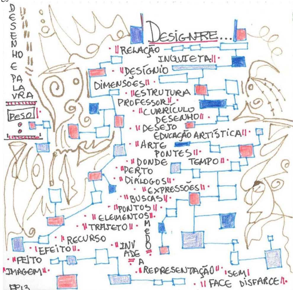
Fig. 1 Configurations and Expressions on my mind – 04 January 2013

The drawings chosen and that can be seen below are from my research diary, and they were made in-between Drawing classes observed and other drawing reflections at UPORTO in 2013. Each one treat main words that make me think and build bridges in my thesis writings. They are mostly mental images that connect my memories and living experiences with the drawing epistemology.